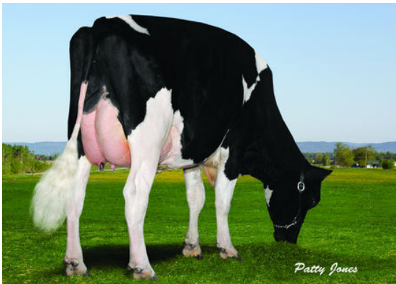
ALLENSITE JERRICK MISTY